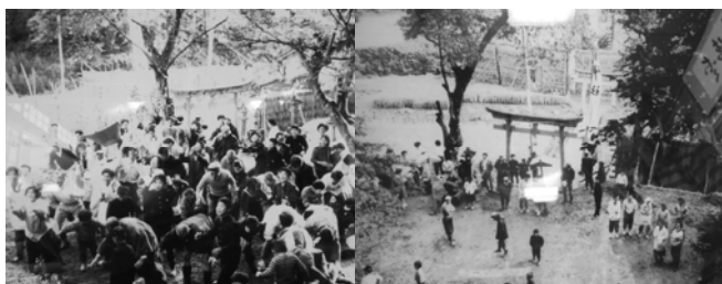
昭和30年代頃の徳神社での餅まき風景