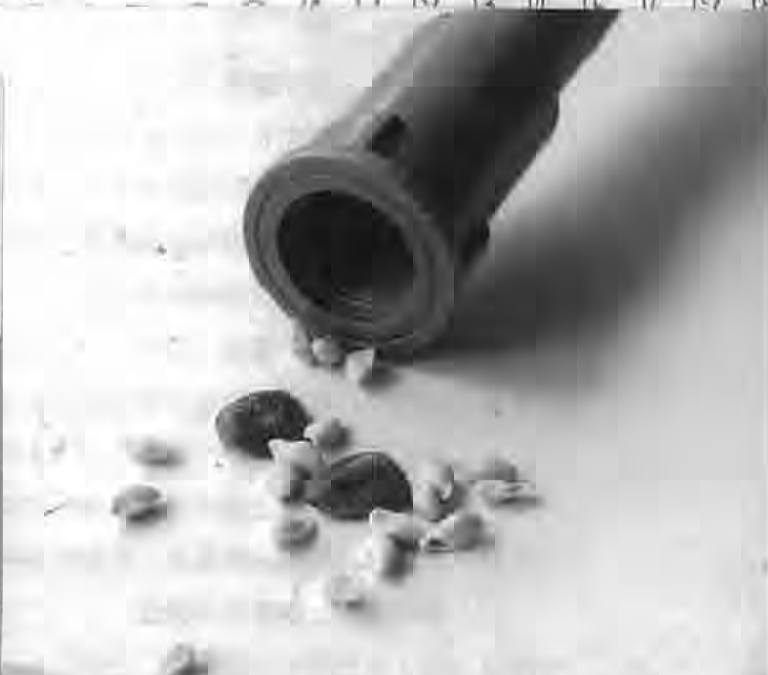
写真4 内径23mmのパイプにストックしたタネ