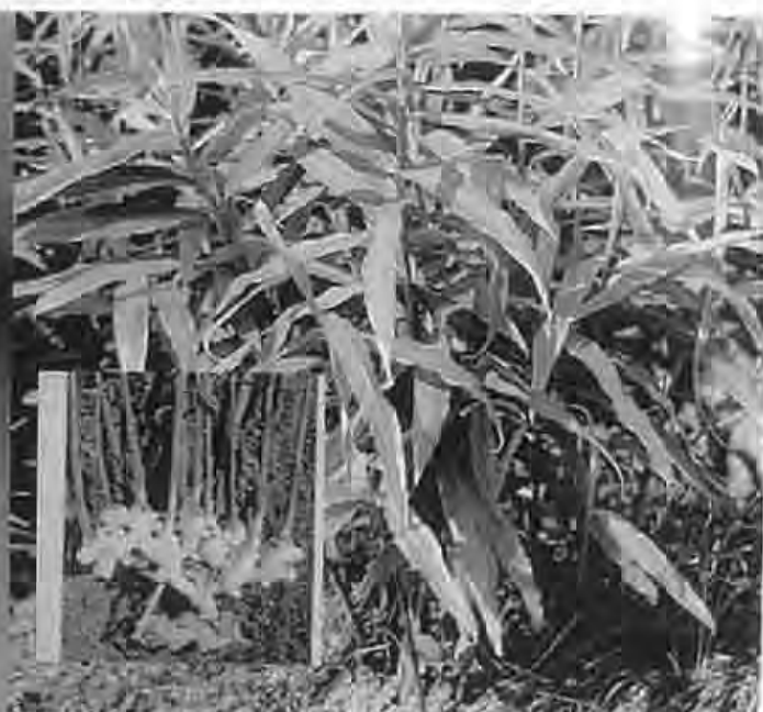
写真-6 生姜「岡山の薬草」(山陽新聞社)より