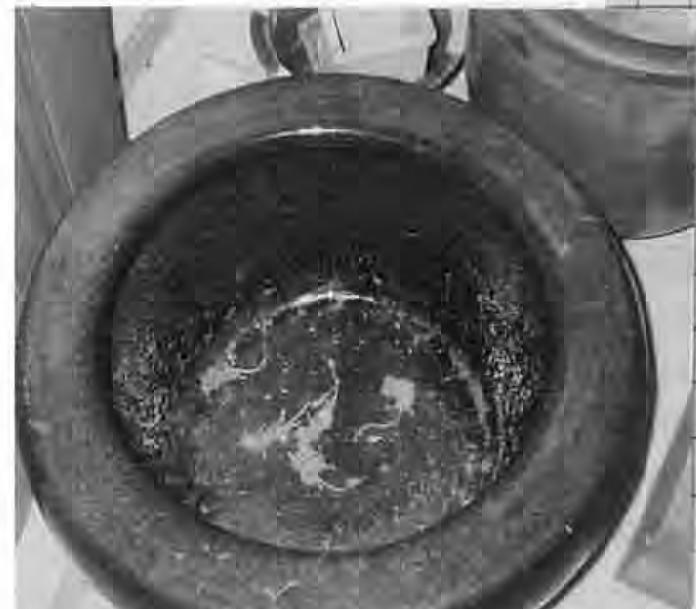
写真2 火鉢のトラップ (5 白骨死体)