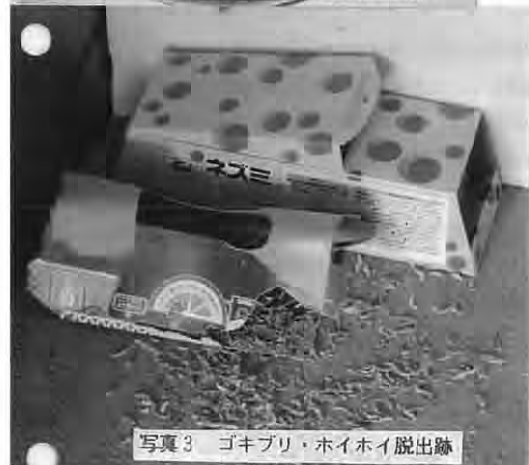
写真3 ゴキブリ・ホイホイ脱出跡